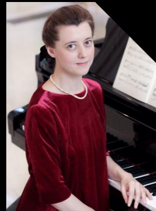
ピアノ：イリーナ・メジュエワ