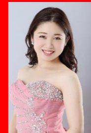
山路真里奈 (ソプラノ)