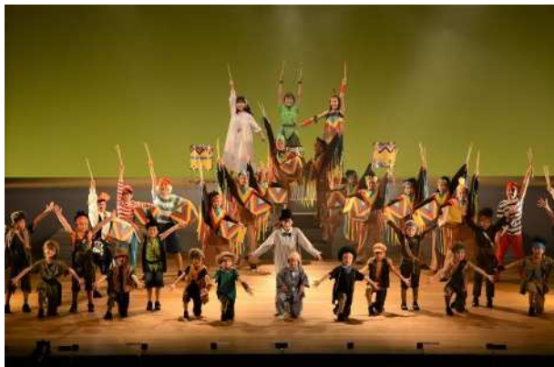
伊賀こどもミュージカル