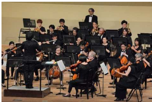
クラシックのいろは

・協会が志向する「文化まちづくり事業」の基盤事業と位置付ける、クラシック人口1%を目指そうプロジェクト「クラシックのいろは」を継続的かつ拡充に努め、幅広い年齢層に応じたクラシック音楽公演を多数開催する。また、地域のクラシックファンの裾野を広げるため、次世代育成プログラム「ぶんとチャイルドクラシックプログラム」の展開や、若手のプロ・アマ音楽家で結成する地域オーケストラ「IGA オーケストラアンサンブル BUNTO」等を展開し、クラシック音楽による音楽文化の創造と定着に努める。