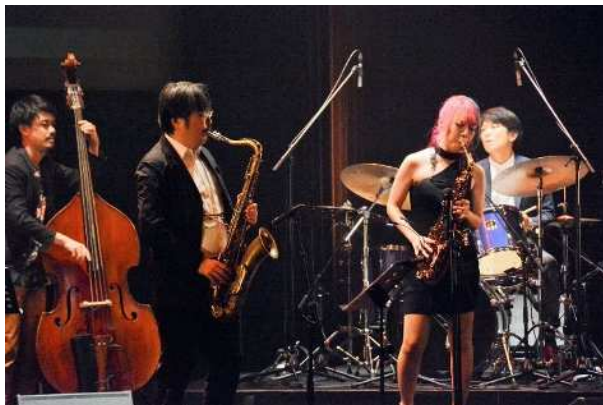
SUPER JAZZ LIVE