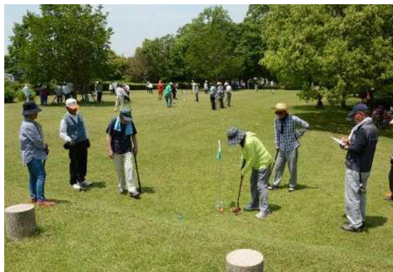
古代遺跡 de グラウンドゴルフ