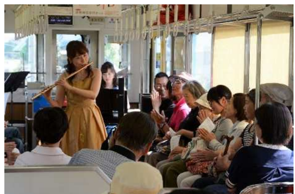
伊賀鉄道ミュージックトレイン