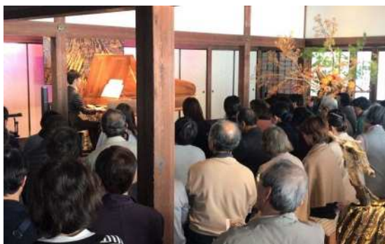
灯りと華ライブ「宮廷の華 チェンバロの世界」