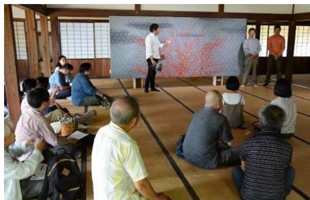
ギャラリートーク (roundtrip 展)

■光の ART 展Ⅶ、灯りと華のプロムナード action X (「伊賀上野灯りの城下町」協働事業)、手づくりアートのひな人形展 (「伊賀上野城下町のおひなさん」共催事業)、AKAIKE ART GALLERY、伊賀×信楽 陶展 (仮称) など