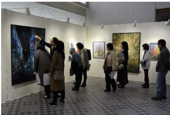
市展「いが」(絵画部門)