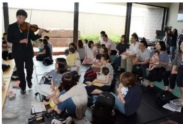
チャイルドクラシックプログラム

■クラシックのいろは 2020（ホールコンサート、なるほど～クラシック、bimonthly コンサート、ぶんとチャイルドクラシックプログラム「おなかのなかから小学生になるまで」）、スプリングコンサート「展覧会の絵」（*）など