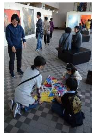
文化会館まるごと美術館

■ケロポンズコンサート、百花繚乱ー「和」の饗宴ー(*)、伊賀発創作ダンスエンタテインメントーSHINOBIー(*)、第15回さんさんコンサート、第40回新人演奏会 in いが、30周年記念青山推薦コンサート、ブルース伊賀の乱、フライデーナイトライブ(*) など