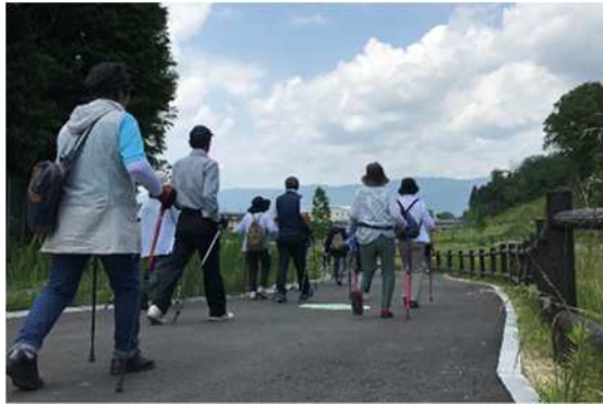
ノルディックウォーキング