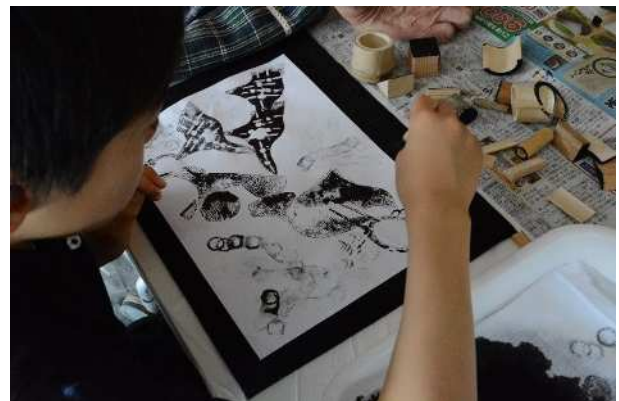
キッズ・アカデミー「目指せアーティスト」

■伊賀発創作ダンスエンタテインメントーSHINOBIー (再掲)、紡ぐーTSUMUGUー(*)、クラシックのいろは 2020 bimonthly コンサート (再掲)、第40回新人演奏会 in いが (再掲)、30周年記念青山推薦コンサート (再掲)、ぶんとキッズ・アカデミー「目指せアーティスト」、第16回「市展いが」 など