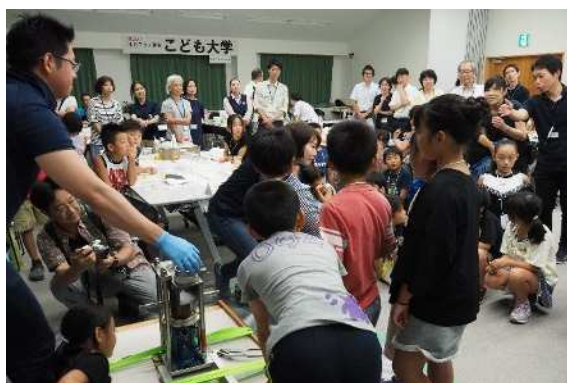
こども大学 Science Lab