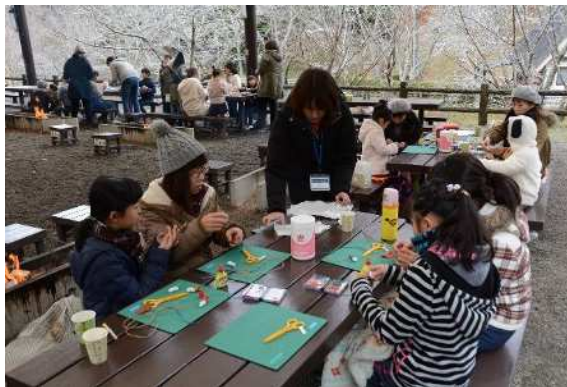
冬のガーランド作り

■親子で楽しむアウトドアクッキング、キャンプ場で学ぶ防災対策～アウトドアの知識を防災に～