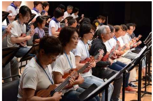
楽器体験シリーズ「ウクレレ」

■ (仮称) ミュージカルサマースクール(*)、パパたちのピアノ発表会(*)、伊賀エンゲキ塾、楽器体験シリーズ第8弾「ヴァイオリン」ワークショップ など