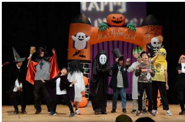
ハロウィンフェスタ in いが