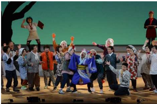
伊賀流ミュージカル「カタッ！」