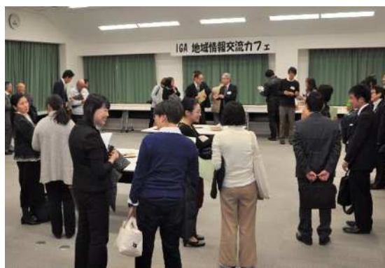
IGA 地域情報交流カフェ