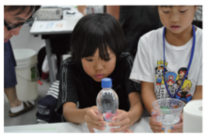
ペットボトルに圧力を加え浮力の観察!