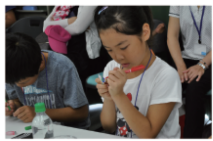
魚の醤油入れにカラーリング。