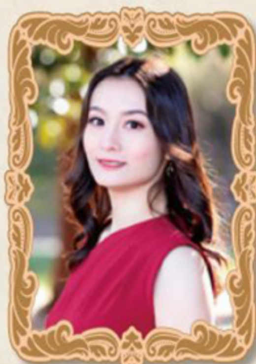
メゾソプラノ 山際きみ佳