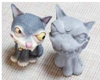
粘土による原型と着色後の完成品